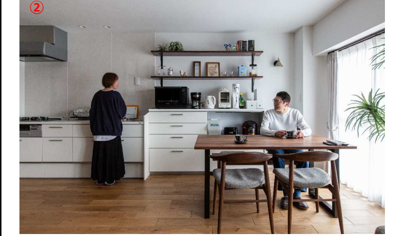
リフォーム後の写真（作品テーマ、工事内容が明確に分る内容の写真。写真4枚程度）