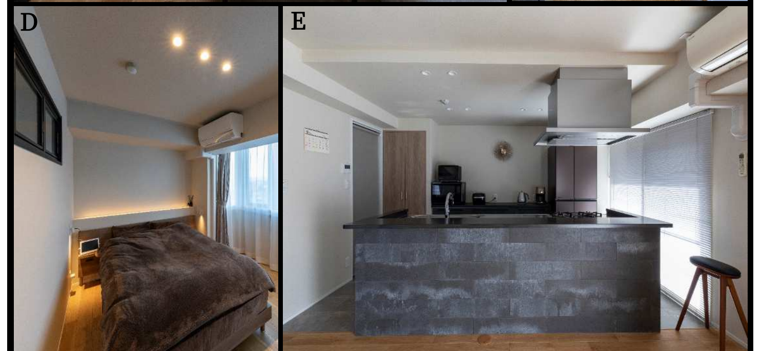
▲ホテルのように間接照明、手元のスポット等多灯照明に