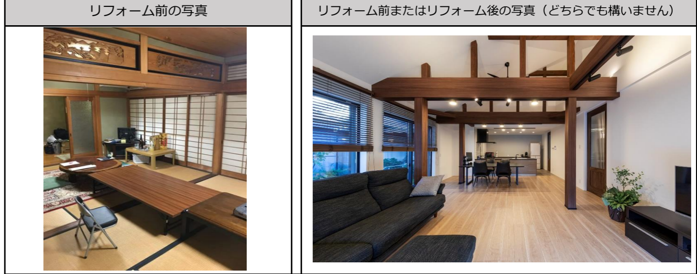
リフォーム後の写真 (作品テーマ、工事内容が明確に分る内容の写真。写真4枚程度)