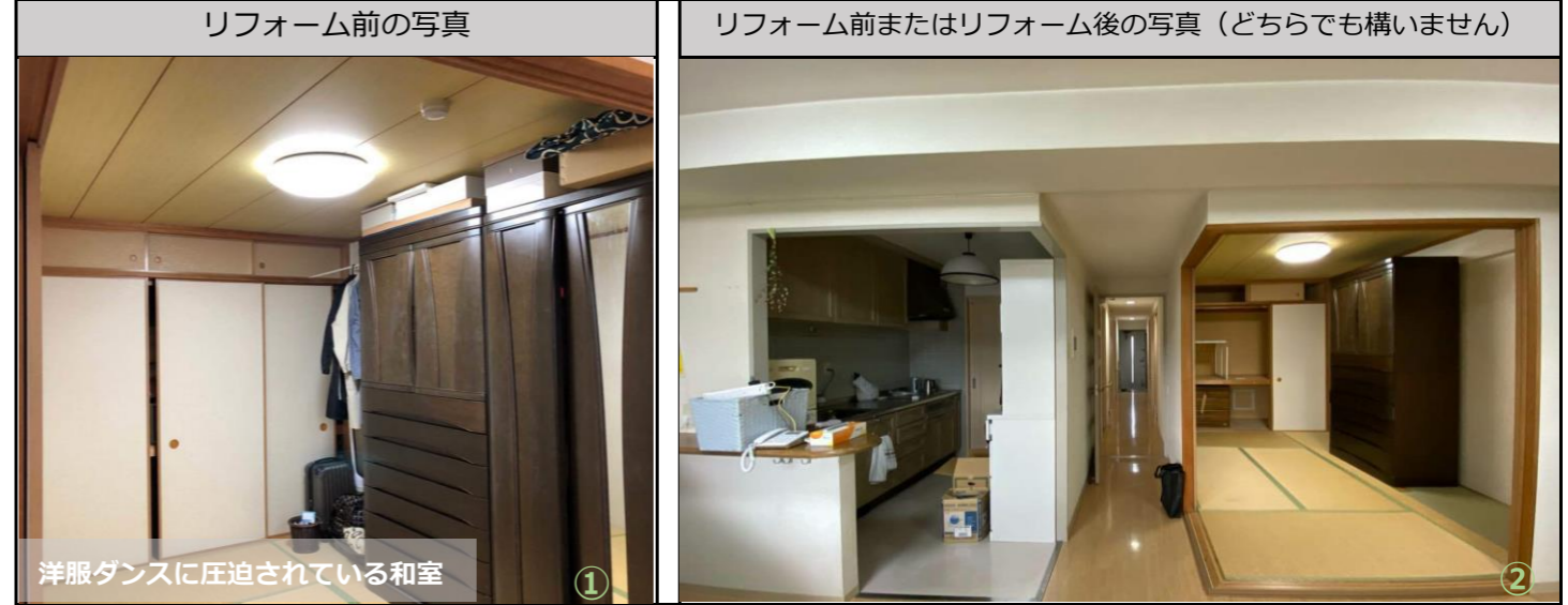
リフォーム後の写真 (作品テーマ、工事内容が明確に分る内容の写真。写真4枚程度)