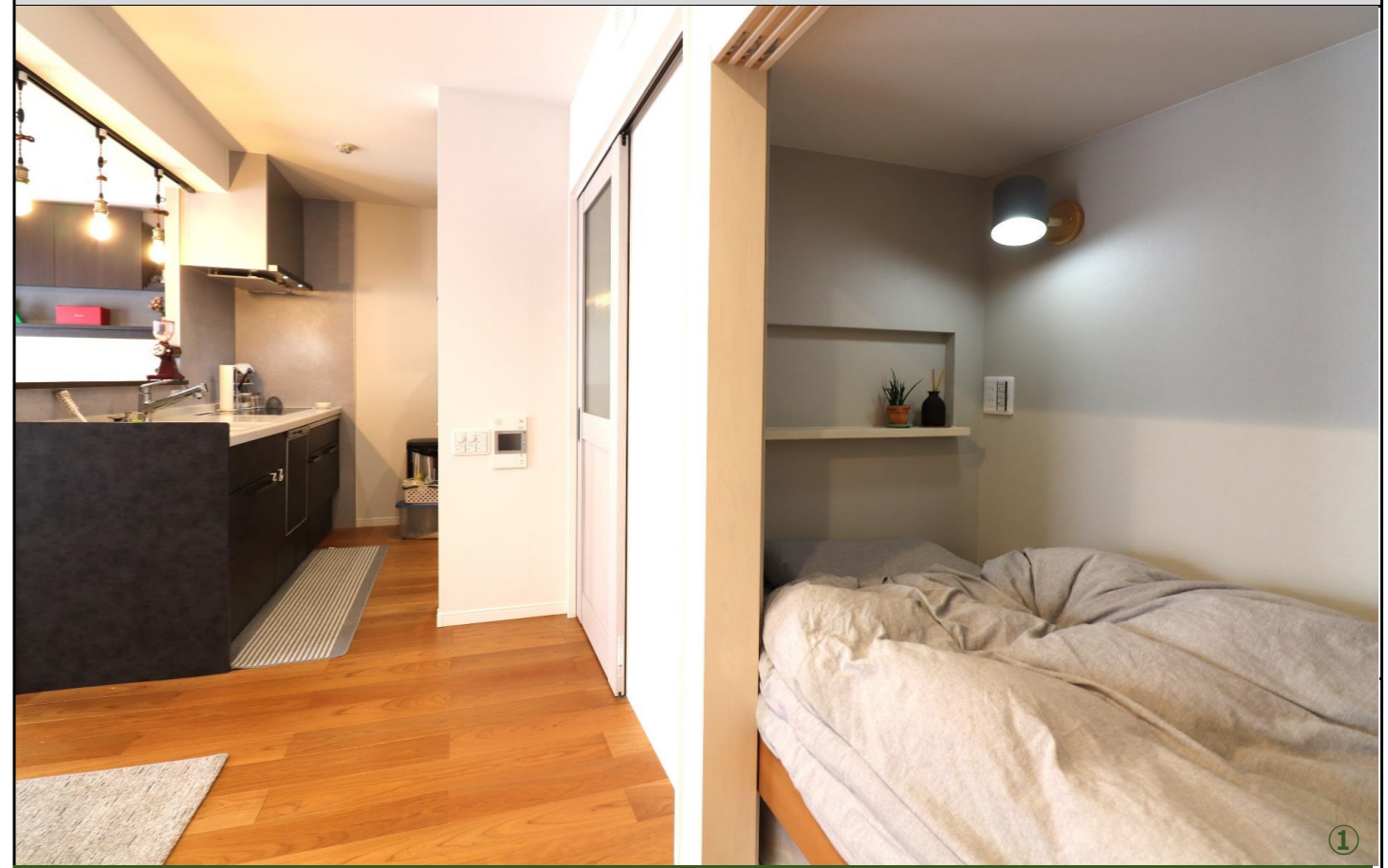
扉を閉めればインテリアの邪魔をしないベッドルーム