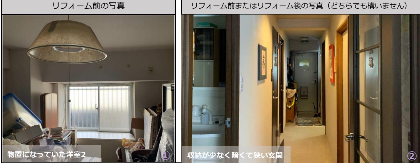
リフォーム後の写真 (作品テーマ、工事内容が明確に分る内容の写真。写真4枚程度)