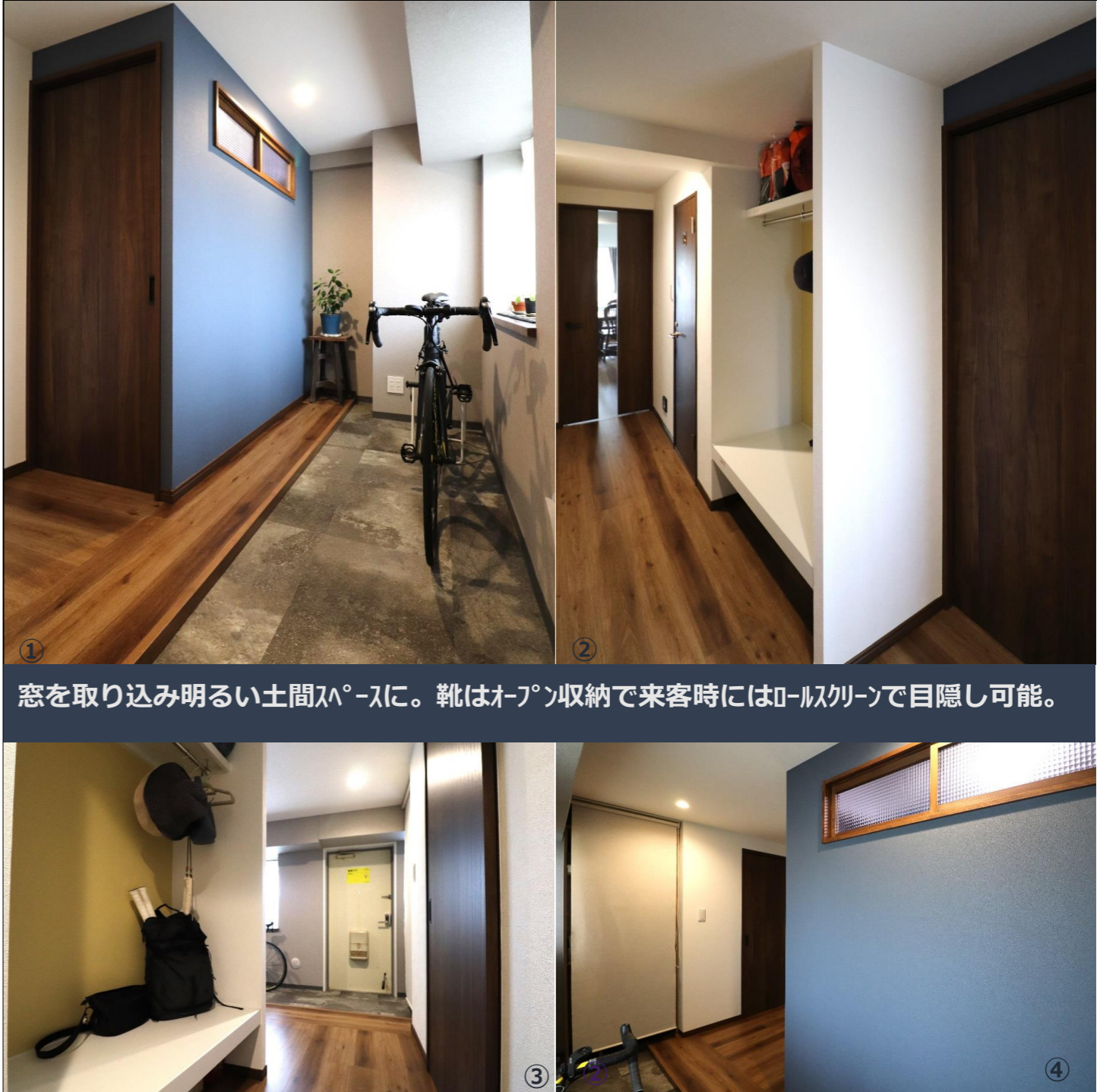
窓を取り込み明るい土間スペースに。靴はオープン収納で来客時にはロールスクリーンで目隠し可能。