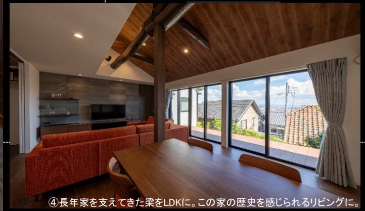
④長年家を支えてきた梁をLDKに。この家の歴史を感じられるリビングに。