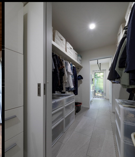
⑥浴室→洗面→WIC→ランドリースペースの回遊導線