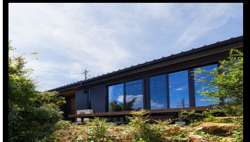
①外壁はサイディングとした。南側にはLDKから繋がるウッドデッキを新設。