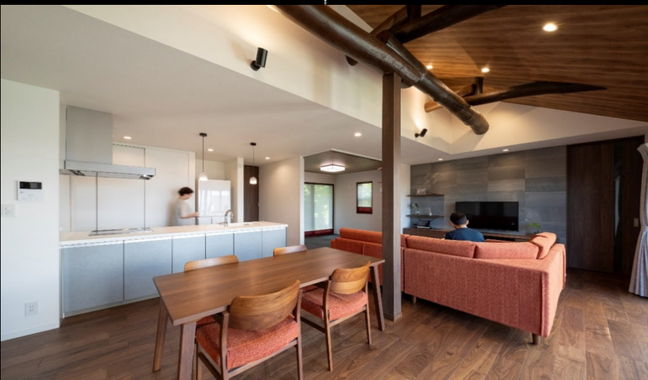
③キッチン廻りの収納はスッキリ見えるように工夫。LDKで過ごすゆったりしたご夫婦の時間。