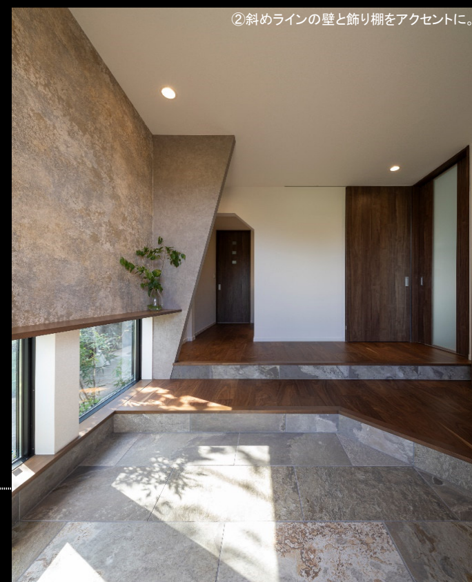
②斜めラインの壁と飾り棚をアクセントに。