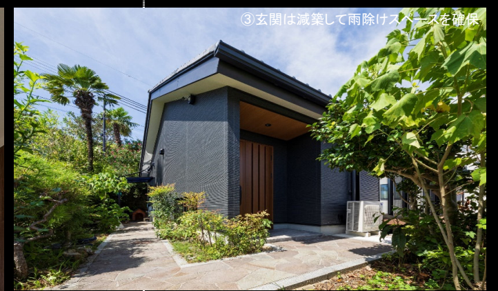
③玄関は減築して雨除けスペースを確保