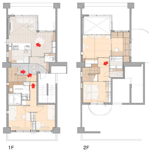
リフォーム後の平面図