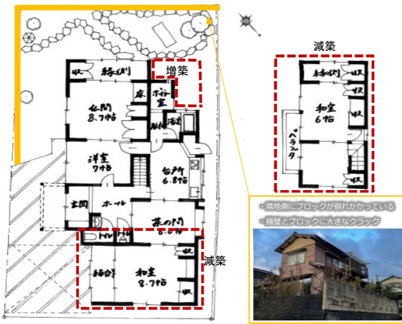
リフォーム後の平面図