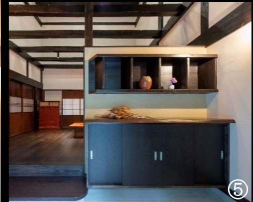
解体した蔵の梯子を玄関に移設 新しい木では出ない味のある飾り棚に