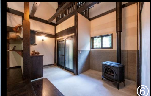
娘夫婦の新築であきらめた薪ストーブは 実家で実現させ、みんなの夢が詰まった 素敵な玄関ホールに