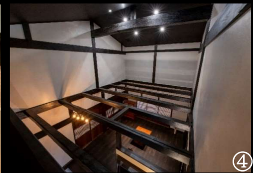
使っていない二階の部屋を玄関ホールから吹き抜けにしました