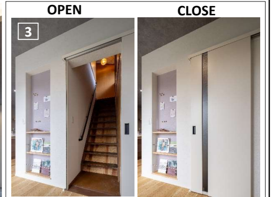
▲階段前に引戸を設置して暖気が上がらないように。扉が目立たないよう、壁になじむデザインとした。1階中心の生活ではあるが、安全の為に手摺を設置。 ◀景色を邪魔しないよう、天井付けの換気扇フードに。2方向から緑を眺められる大開口の窓。