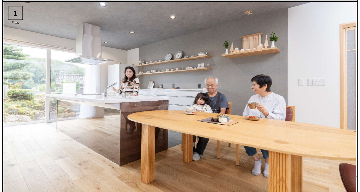
庭だけではなく、里山も眺められる開放的なLDK。キッチン収納上にはニューヨークで購入したお気に入りの食器を並べて。ダウンライトスピーカーからは心地よい音楽が流れる。