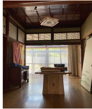
縁側がありお庭が活かされておらず、暗い。