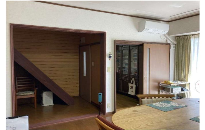
居間と階段の間は開口で暖房を入れても寒い…。急な階段で手摺がなく危ない。