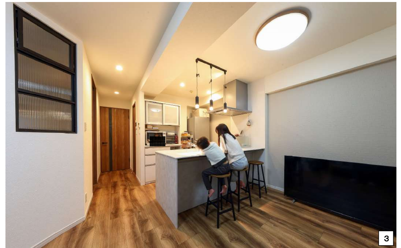
リフォーム後の写真（作品テーマ、工事内容が明確に分る内容の写真。写真4枚程度）