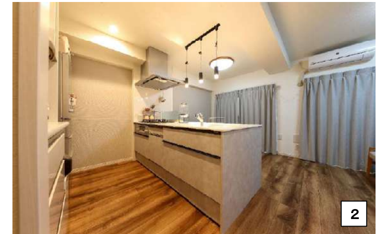
リフォーム前またはリフォーム後の写真（どちらでも構いません）