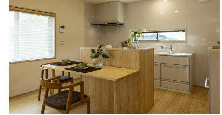
リフォーム後の写真（作品テーマ、工事内容が明確に分る内容の写真。写真4枚程度）