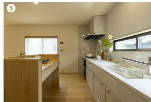
飽きが来ず母娘で長く使えるようにデザインは全体的にシンプルに