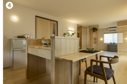
作業台と一体化した造作のダイニングテーブルは使い勝手も抜群です