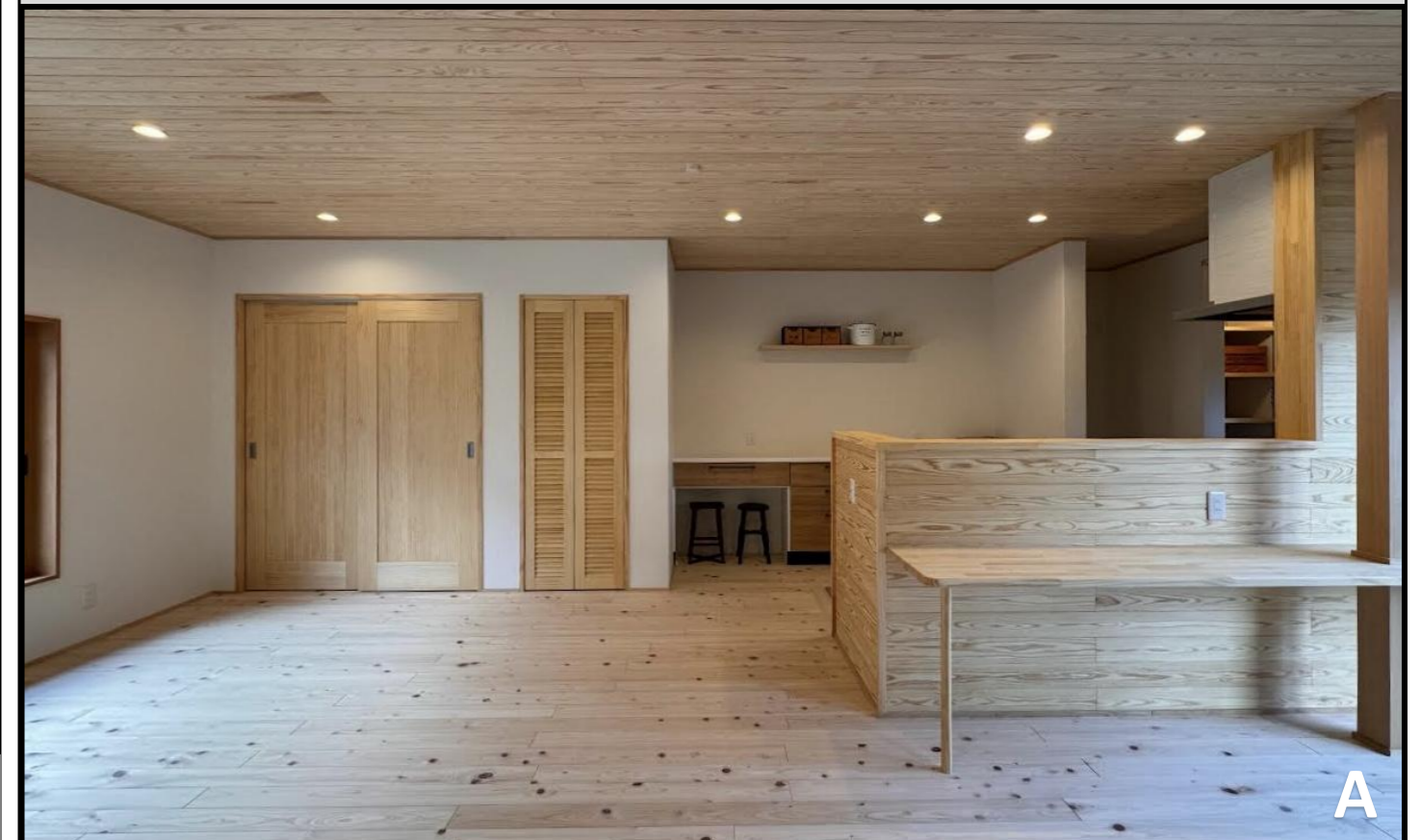
A. 日当たりの良い南窓際にダイニング兼遊び場スペースを配置。冬は特にほんわかして気持ちいい。