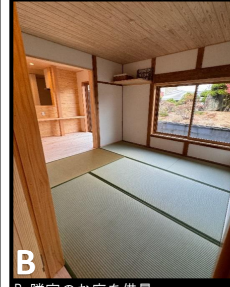
B. 隣家のお庭を借景