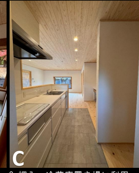
C. 押入→冷蔵庫置き場に利用