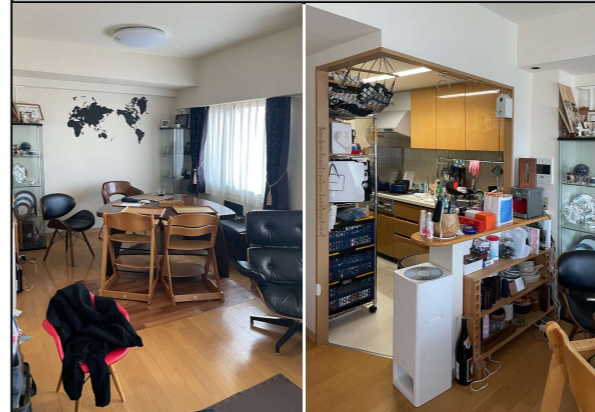
▲リビング・ダイニング ▲キッチン