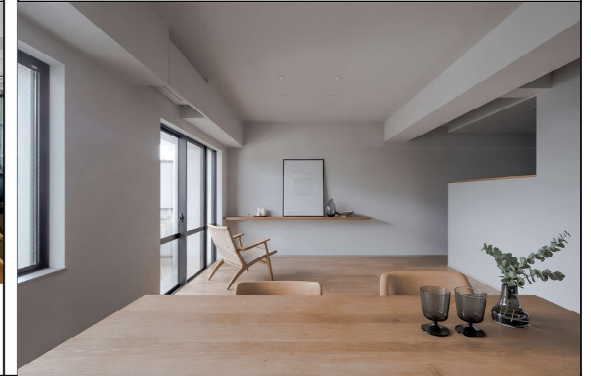
リフォーム後の写真 (作品テーマ、工事内容が明確に分る内容の写真。写真4枚程度)